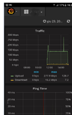
Visualizzazione da Smartphone